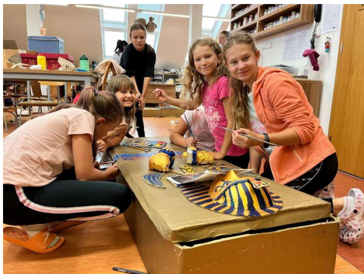
Tajemství posvátného skarabea