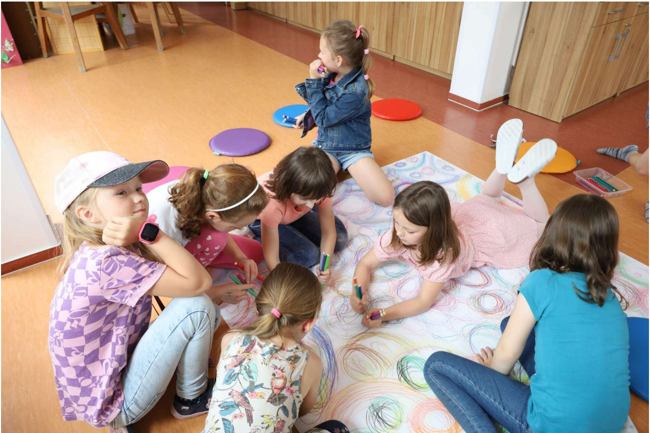
Umělcem na zkoušku