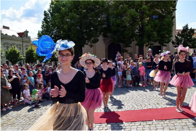
Je libo klobouček?