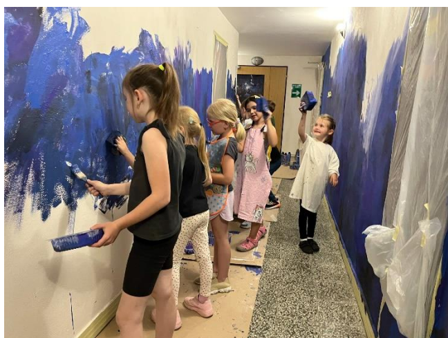
Chodba k planetáriu