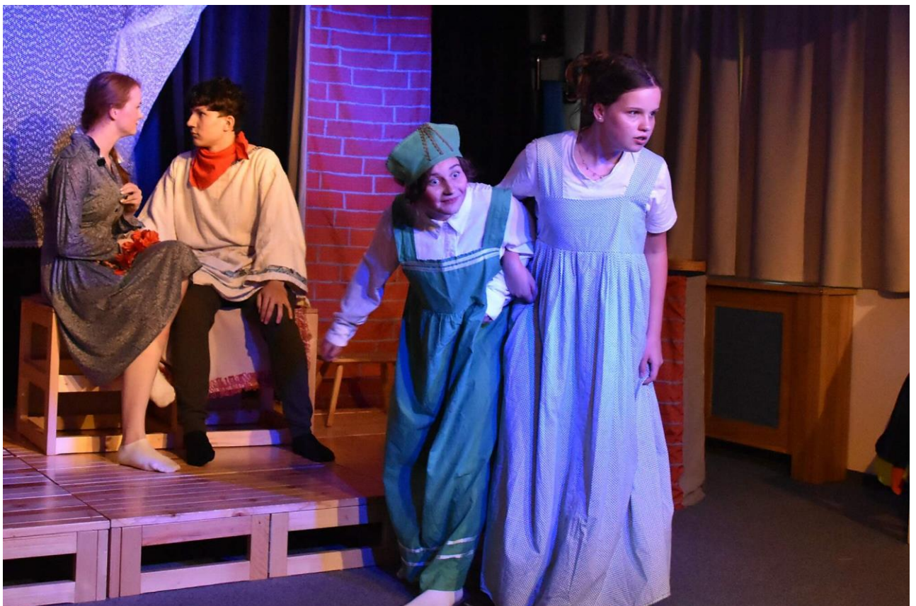
Finist, jasný sokol