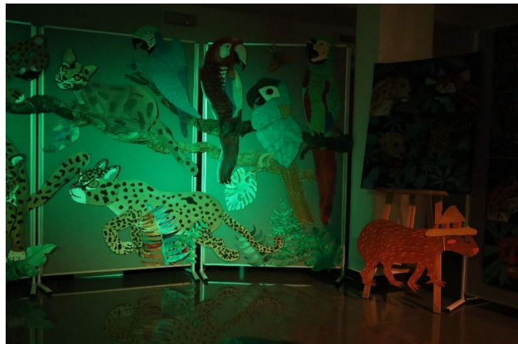
O čem sní jaguár