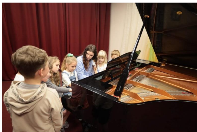
Umělcem na dvě hodky