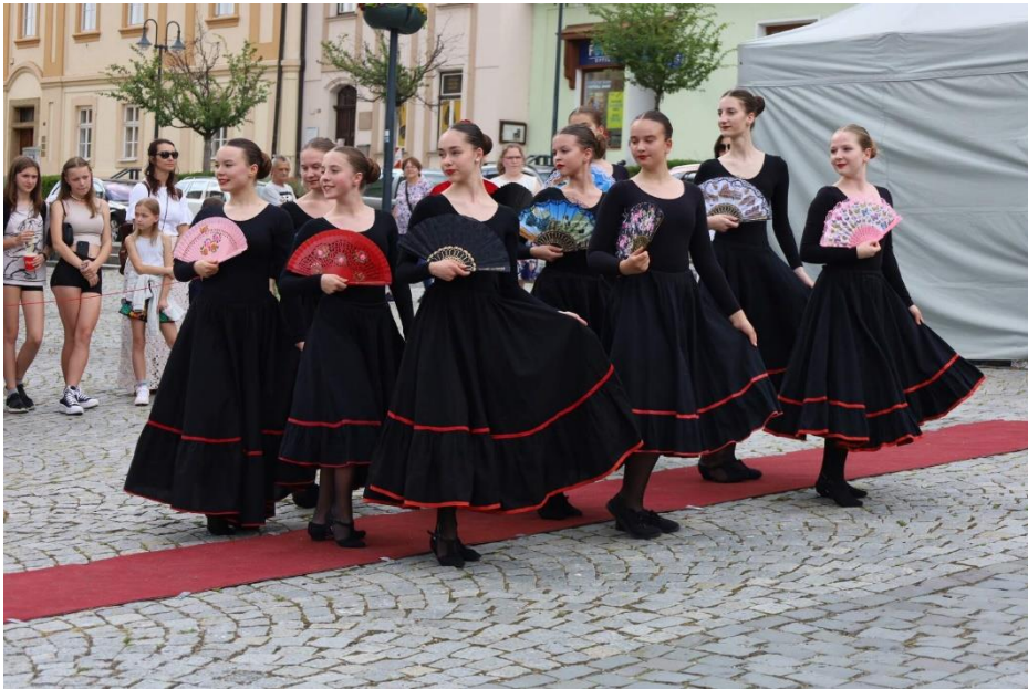
Přehlídka Jen tak se ovívat