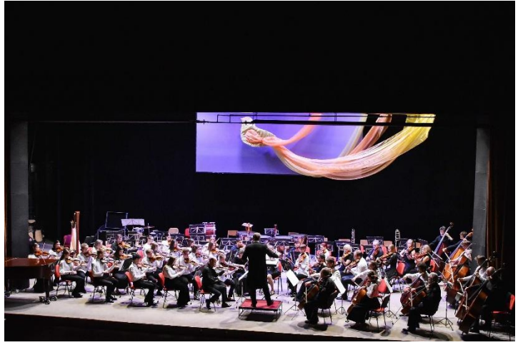
Malí velcí filharmonici