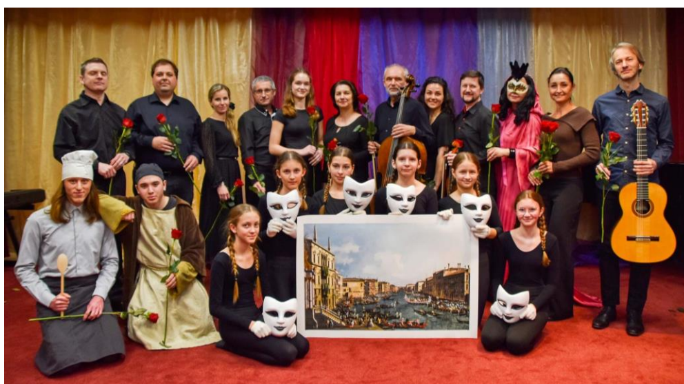
Konzert pro jeden obraz