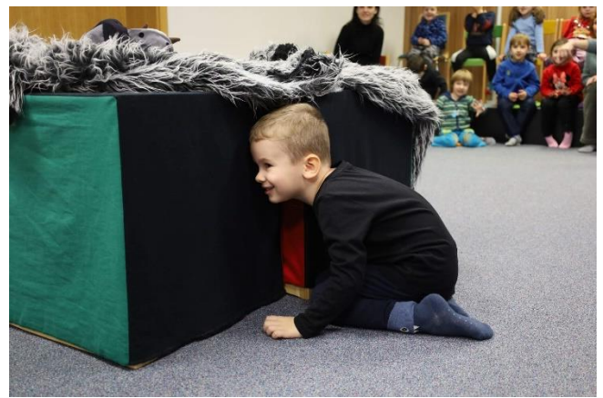
Hrátky pro mateřské školy