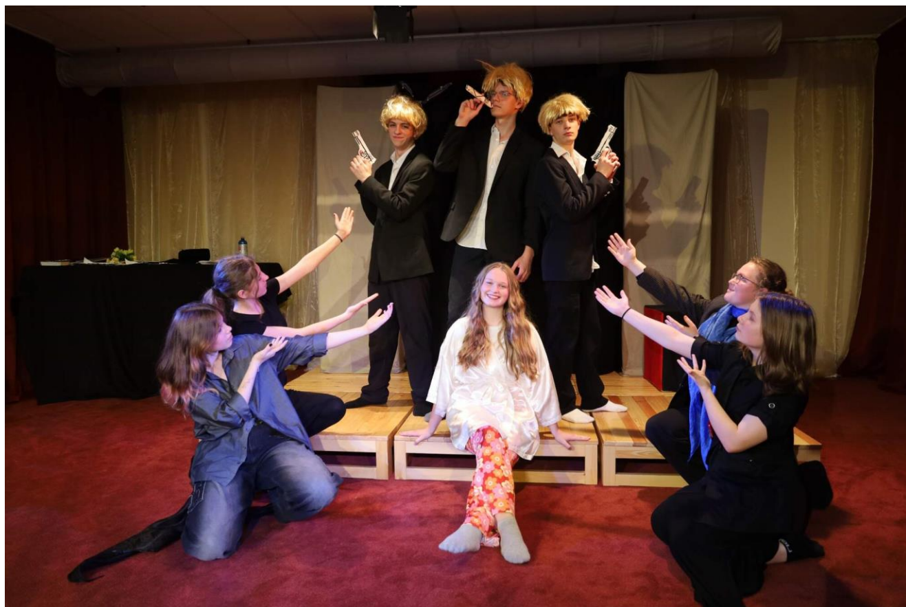
Pozor, natáčí se!