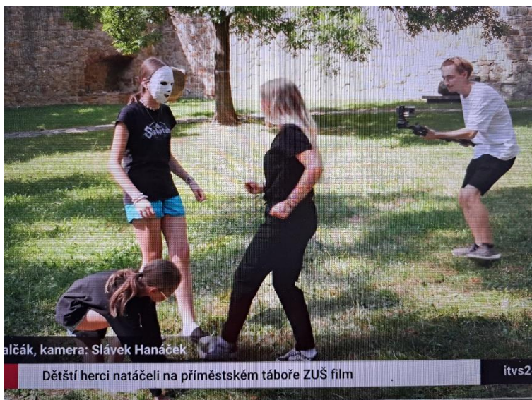
malčák, kamera: Slávek Hanáček Dětsí herci natáčeli na příměstském táboře ZUŠ film itvs24